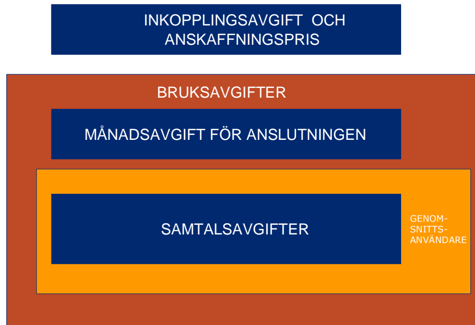
Diagram 1. Prissättning av grundläggande telefonitjänster.

De telefonitjänstprodukter som tillhandahålls inom ramen för samhällsomfattande tjänster består av de delområden som presenteras i principdiagrammet nedan.